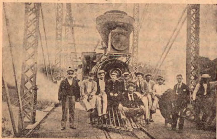
1906 - Pasada de la primera locomotora "moderna" por Barranca

SE CALCULA QUE LA PRODUCCION ALGODONERA DEL PACIFICO ABARCARA UN TOTAL DE MAS DE DOCE MIL QUINTALES, QUE VENDIDO A DOSCIENTOS COLONES CADA UNO, DA UNA SUMA MUY APRECIABLE QUE VIENE A ROBUSTECER LA ECONOMIA NACIONAL.