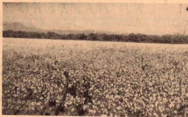
Un campo sembrado de algodón en Guanacaste