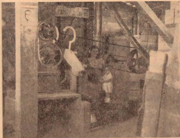
Interior de la Piladora de Arroz y vista del frente del edificio.