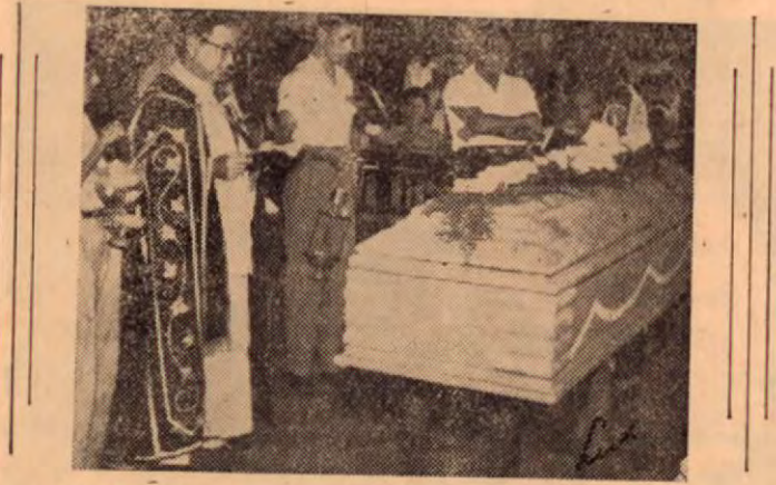
Momento de las exequias litúrgicas en la Iglesia