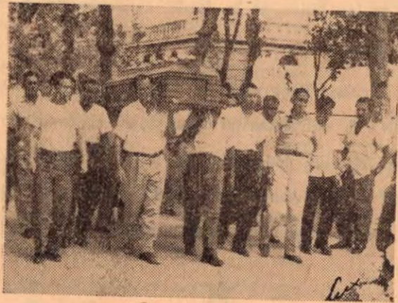
Entrando al templo en brazos de sus amistades y deudos