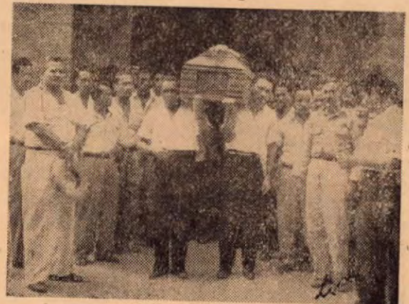
Saliendo del templo